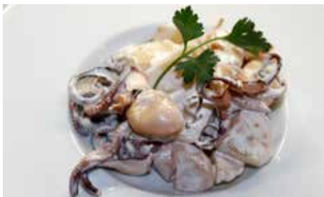
Recepta i imatge: www.lacuinaadesempre.cat

Un cop els pops siguin cuits, retireu-los amb una escumadora i reserveu-los. En el mateix brou de coure els pops poseu-hi a coure les patates. Un cop feta la patata, ja podeu passar els pops a la cassola que servireu a taula. Seguidament, heu d'escórrer la patata cuita i afegir-la a la mateixa cassola del pop. Agafeu un cullerot del brou de coure el pop i les patates i barregeu-lo amb l'allioli, per deixatar-lo perquè es talli. Escampeu aquest allioli negat per sobre del pop i les patates i ja ho podeu servir.