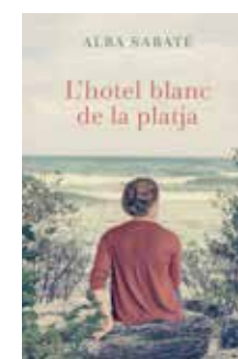
L'hotel blanc de la platja Alba Sabaté