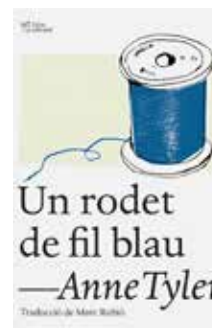
Un rodet de fil blau Anne Tyler