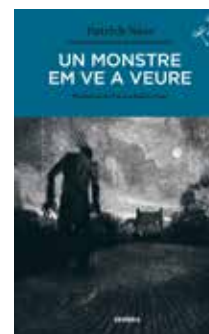
Un monstre em ve a veure Patrick Ness