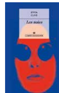
Les noies Emma Cline