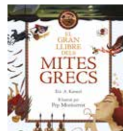
El gran llibre dels mites... Eric A. Kimmel