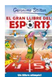
El gran llibre dels esports Geronimo Stilton