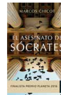
El asesinato de Sócrates Marcos Chicot