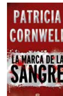
La marca de la sangre Patricia Cornwell