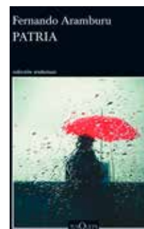
Patria Fernando Aramburu