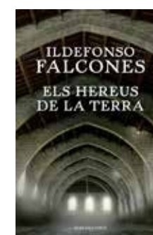
Els hereus de la terra Ildefonso Falcones