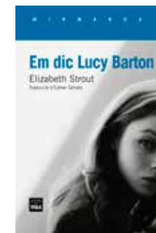
Em dic Lucy Barton Elizabeth Strout