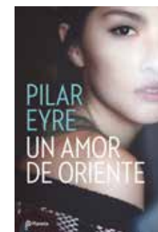
Un amor de oriente Pilar Eyre