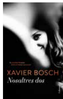
Nosaltres dos Xavier Bosch