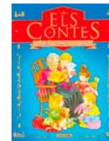
Els contes de la meua àvia Contes de sempre