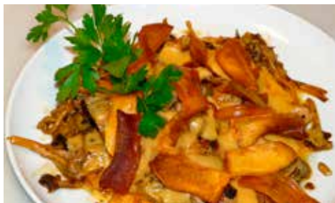
Recepta i imatge: www.lacuinaadesempre.cat

Elaboració: primer de tot cal preparar la crema de moniato. Tot seguit, netegeu els xampinyons i els camagroc. Fregiu quasi tots els xampinyons tallats a làmines fines, conservant els més macos per partir-los només per la meitat. A mitjà cocció afegiu-hi una mica d'all i julivert picats i deixeu-los coure fins que estiguin ben daurats. Netegeu el pollastre, talleu-lo en tires i salpebreu-lo. Fregiu les tires de pollastre en oli ben calent fins que quedin daurades però tendres per dins. Afegiu-hi una mica de pebre vermell dolç. Finalment, en una paella amb una mica d'oli, hi tireu all i julivert i hi salteu els camagroc dos minuts. Per muntar el plat, poseu els xampinyons a làmines i les xips de moniato com a base. A sobre els xampinyons aneu distribuint les tires de pollastre de forma circular. Tireu la crema de moniato per sobre el pollastre, col.loqueu els camagroc als laterals i els xampinyons a meitats i més xips de moniato per damunt.