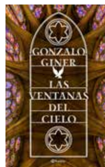
Las ventanas del cielo Gonzalo Giner