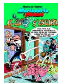
El capo s'escapa! Mortadel·lo i Filemó