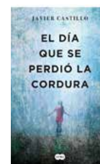
El día que se perdió la cordura Javier Castillo