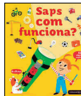
Saps com funciona? Cécile Jugla