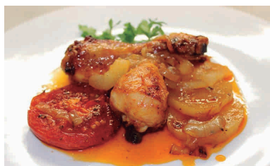
Recepta i imatge: www.catalunyacuina.com