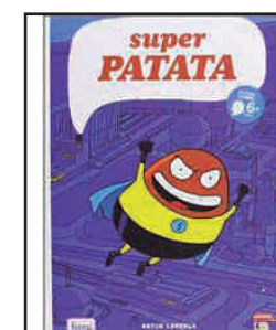
Super Patata Artur Laperla