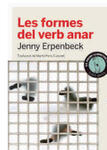
Les formes del verb anar Jenny Erpenbeck