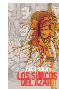
Los surcos del azar Paco Roca