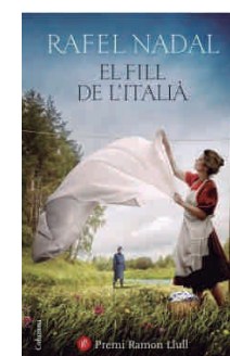
El fill de l'Itàlia Rafel Nadal