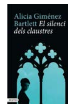
El silenci dels claustres Alicia Giménez Bartlett