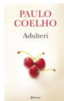
Adulteri Paulo Coelho