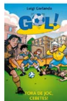
Fora de joc, cebetes! Luigi Garlando