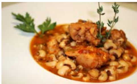
Recepta i imatge: www.lacuinadesempre.cat

Elaboració: el dia abans poseu els fesols en un bol amb el doble d'aigua que de fesols i deixeu-los tota la nit en remull. L'endemà, coleu-los, renteu-los de nou i reserveu-los juntament amb les herbes. Saleu i empebreu el conill i enrossiu-lo en una cassola amb un bon raig d'oli d'oliva.