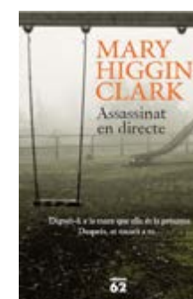
Assassinat en directe Mary Higgins Clark