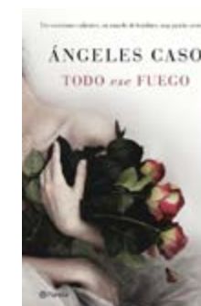
Todo ese fuego Ángeles Caso