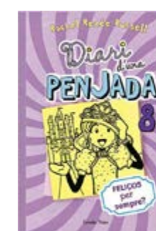
Diari d'una penjada 8 Rachel Renée Russell