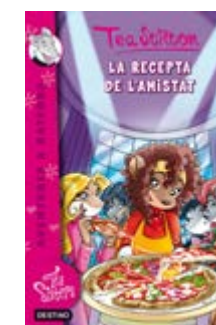
La recepta de l'amistat Tea Stilton