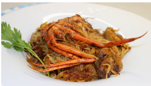
Recepta i imatge: www.lacuinaadesempre.cat

Ingredients per a 4 persones: 250 gr de fideus del número 0, 10-12 xampinyons frescos, 2 o 3 crancs vermells frescos, 1 tros de pebrot vermell trinxat, 3 tomàquets madurs, 2 dents d'all, 1 ceba trinxada, 1 cullerada de pebre vermell, 1 litre i mig de brou de peix, uns brins de safrà, oli d'oliva i sal.