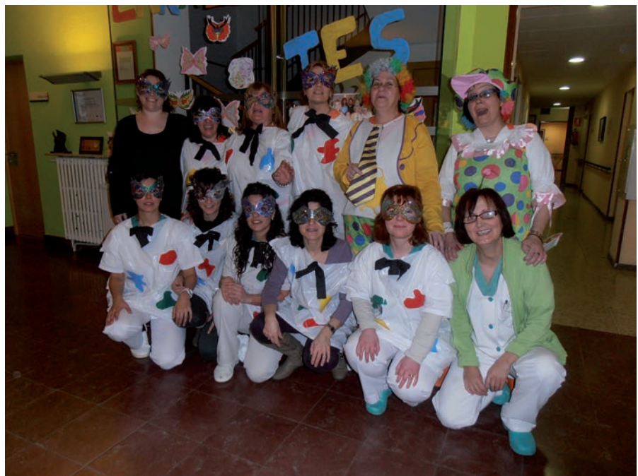
Treballadores de la Residència Emma, compartint alegries i emocions pel Carnaval.

Molts de nosaltres hem coincidit que fem la feina que ens agrada i que volem fer, que no la canviariem per un altra per què el que aprenem aquí, ens ajuda a ser millors persones i ens emplena d'orgull. Podríem dir-ho en poques paraules: “amb molt poc es pot fer molt”; la calidesa humana que manifesten les persones que viuen a la residència ens fa concloure que ells són els protagonistes reals de la nostra tasca i cada un d'ells ens aporta el seu granet de sorra.