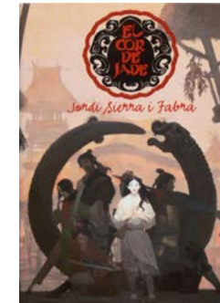
El cor de jade Jordi Sierra i Fabra