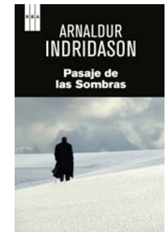
Pasaje de las Sombras Arnaldur Indridason