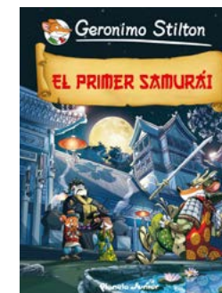
El primer samurai Geronimo Stilton