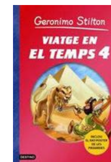
Viatge en el temps 4 Geronimo Stilton