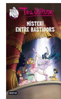
Misteri entre bastidors Tea Stilton