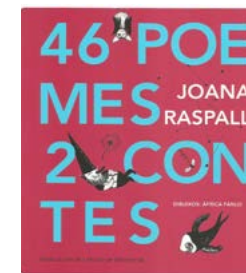
46 poemes, 2 contes Joana Raspall