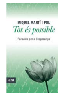
Tot és possible Miquel Martí i Pol