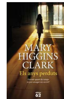
Els anys perduts Mary Higgins Clark