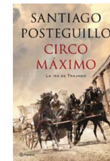
Circo Máximo Santiago Posteguillo