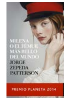
Milena o el fémur... Jorge Zepeda Patterson