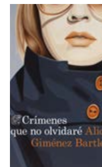
Crímenes que no olvidaré Alicia Giménez Bartlett