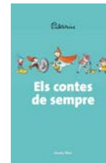
Els contes de sempre Pilarín Bayés