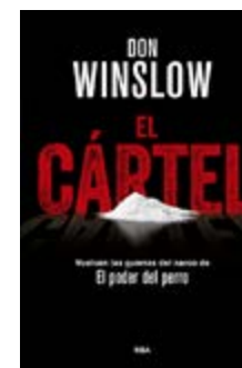
El càrtel Don Winslow