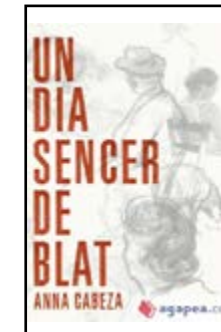
Un dia sencer de blat Anna Cabeza