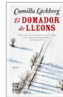
El domador de lleons Camilla Läckberg