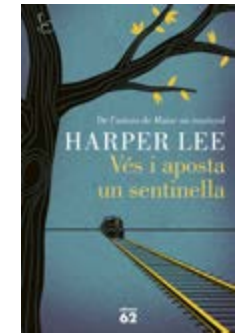
Vés i aposta un sentinella Harper Lee