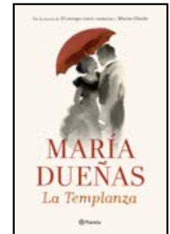
La templanza María Dueñas