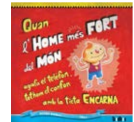
Quan l'home més fort del... Roser Rimbau