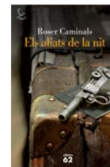
Els aliats de la nit Roser Caminals