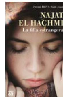
La filla estrangera Najat El Hachmi