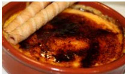
Recepta i imatge: www.lacuinaadesempre.cat

Separeu el cassó del foc i, amb l'ajut d'un colador, incorporeu-hi la barreja dels rovells, sucre i midó. Torneu a posar el cassó al foc (a foc mig-baix) i amb una cullera de fusta aneu remenant poc a poc. Passats pocs minuts notareu que comença a espessir, vol dir que ja la està cuita. Repartiu-la en cassoles individuals de fang. Tapeu-les amb paper film per evitar que es formi un tel, deixeu-les refredar a temperatura ambient i, quan siguin fredes, conserveu-la a la nevera. Us les podeu menjar així o cremades.