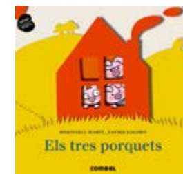
Els tres porquets M. Martí / X. Salomó