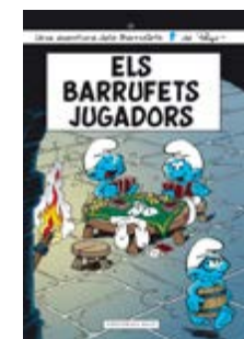
Els barrufets jugadors Peyo