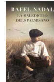
La maledicció dels Palmisano Rafel Nadal