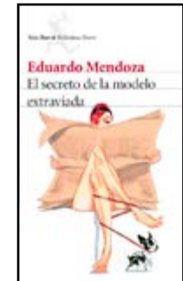
El secreto de la modelo... Eduardo Mendoza