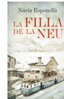
La filla de la neu Núria Esponellà