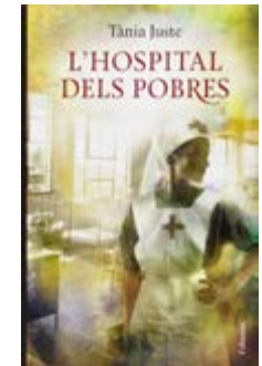
L'hospital dels pobres Tània Juste