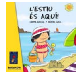
L'estiu és aquí! Cinta Arasa