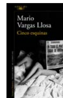
Cinco esquinas Mario Vargas Llosa