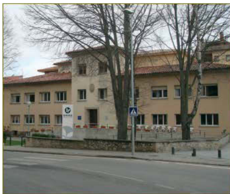
desembre del 2009

Aquestes actuacions, juntament amb la inversió que es durà a terme en el marc del segon Fons d'Inversió Local, serviran per a continuar millorant la nostra residència per a la gent gran.