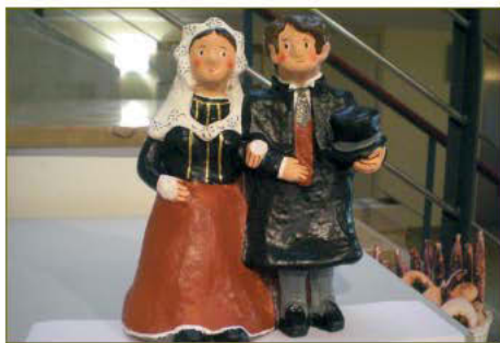
desembre del 2009

La commemoració va finalitzar amb un sopar de germanor al restaurant "La Teuleria".