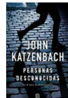
Personas desconocidas John Katzenbach