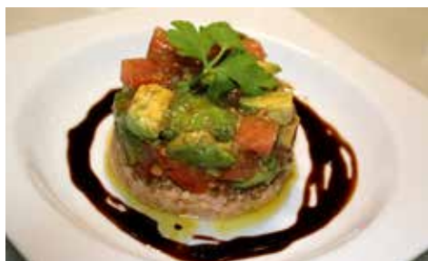
Recepta i imatge: www.lacuinaadesempre.cat

Elaboració: talleu l'alvocat per la meitat fins tocar l'os, obriu-lo amb un gir i feu saltar les dues bandes. La pell ja sortirà sola, amb les mans es pot treure fàcilment sempre que l'alvocat estigui al punt. Traieu l'os i talleu l'alvocat a daus no massa grans. Feu el mateix amb el tomàquet i saleu-ho tot barrejat. Ara incorporeu el vinagre de mòdena, poseu-n'hi un raig al gust. Feu el mateix amb un bon raig d'oli d'oliva verge extra. Remeneu-ho tot bé i deixeu-ho reposar, almenys una hora, a la nevera.