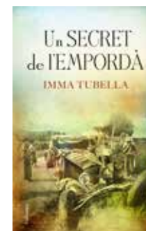
Un secret de l'Empordà Imma Tubella