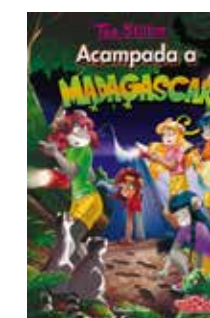
Acampada a Madagascar Tea Stilton