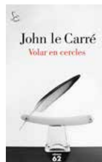
Volar en cercles John Le Carré