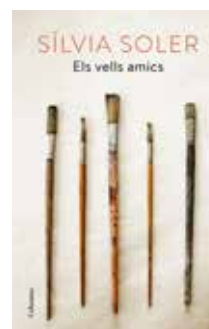
Els vells amics Sílvia Soler