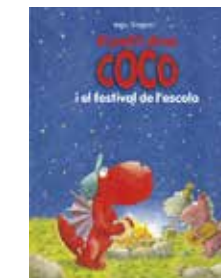
El petit drac Coco... Ingo Siegner