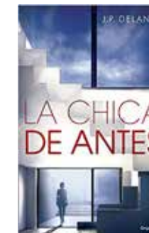
La chica de antes J. P. Delaney