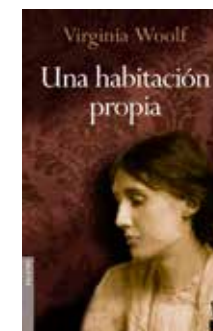
Una habitació propia Virginia Woolf