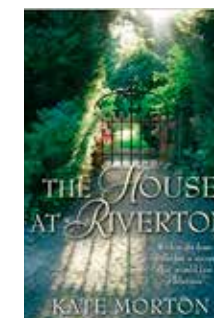
The house at Riverton Kate Morton