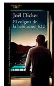
El enigma de la habitació... Joël Dicker