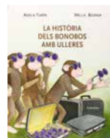
La història dels bonobos... A. Turin i N. Bosnia