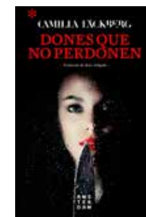
Dones que no perdonen Camilla Läckberg