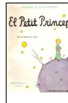
El petit Príncep Antoine de Saint-Exupéry