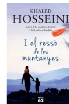
I el ressò de les muntanyes Khaled Hosseini