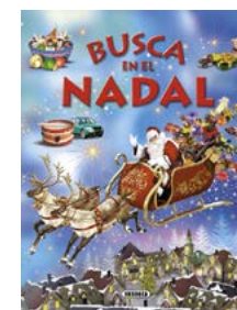
Busca en el Nadal Eduardo Trujillo