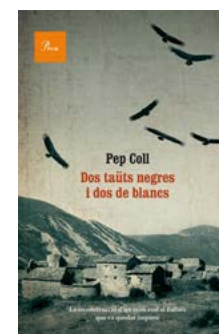
Dos taüts negres i dos... Pep Coll