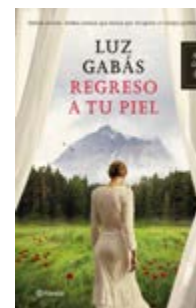
Regreso a tu piel Luz Gabás