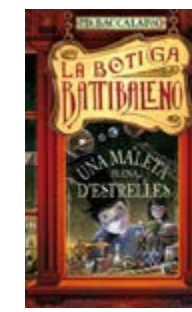
Una maleta plena d'estrelles P.D. Baccalarario