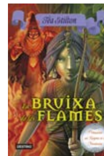
La bruixa de les flames Tea Stilton