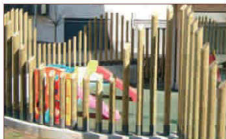
maig del 2008

Es va construir la nova Llar d'Infants en tres mesos, un temps rècord. Es va fer el trasllat durant les vacances de Nadal, complint així el compromís donat als pares, per tal de no interrompre el bon funcionament del curs escolar.