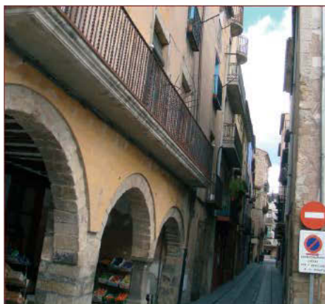
Adequació Carrers Vila Vella

programat per a l'any 2011, per la qual, si això no canvia, fins aquell any no es podran començar les obres de soterrament de la línia elèctrica i de canalització del torrent que creua els terrenys on es vol construir el futur centre escolar de St. Joan; i el quart motiu és que queden sense finançament projectes com el dipòsit d'aigua, l'arranjament dels carrers de la vila Vella i la instal·lació de gespa artificial al camp de futbol.