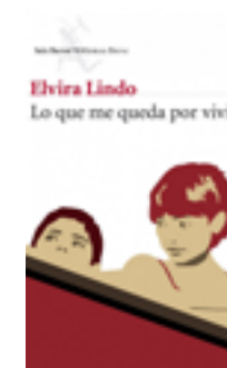
Lo que me queda por vivir Elvira Lindo