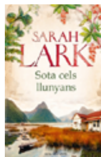
Sota els cels llunyans Sarah Lark