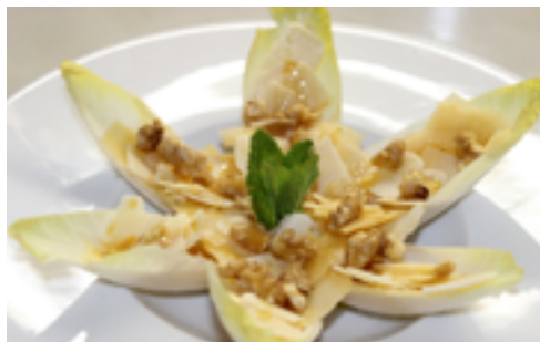
Recepta i imatge: www.lacuinadesempre.cat

Elaboració: Comenceu fent la salsa. Poseu la mel i la mostassa en un bol, barregeu-ho bé fins que els dos ingredients quedin totalment integrats i reserveu-ho a la nevera. Talleu les endívies, separeu les fulles i reserveu el cor. Amb un paper humit netegeu les fulles. Peleu la poma i amb el mateix pelador, feu-ne tires i les aneu reservant. Recupereu el cor de les endívies que abans heu reservat i, un cop net, el trinxeu i el col·loqueu al mig del plat. Aquesta base us farà de suport per a les fulles. Seguidament, tireu-hi un raig d'oli d'oliva per sobre. Podeu salar lleugerament les fulles, però la sal del formatge serà suficient per aquesta amanida. Col·loqueu la poma per sobre les fulles i el formatge. A continuació, poseu-hi trossos de nou i una fulla de menta per rematar estèticament l'amanida, alhora que hi aportarà un fresc aroma. Per acabar, amaniu el plat amb la salsa de mel i mostassa.