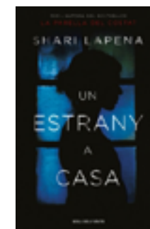
Un estrany a casa Shari Lapena