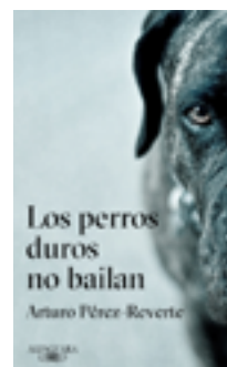
Los perros duros no bailan Arturo Pérez-Reverte