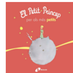
El Petit Príncep per als... Antoine de Saint-Exupéry