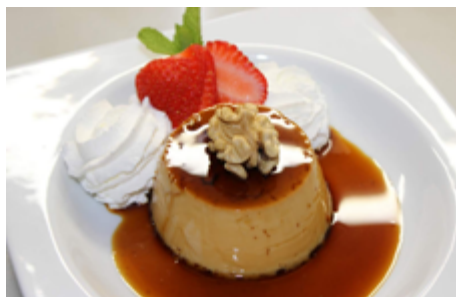
Recepta i imatge: www.lacuinadesempre.cat

Elaboració: poseu la ratafia en un cassó i deixeu que redueixi gairebé a la meitat. Apagueu el foc i deixeu que es refredi una mica. Poseu a escalfar la meitat de la llet en un cassó, afegiu-hi els 85 grams de sucre i remeneu-ho. Deixeu que arrenqui el bull i ho apagueu. En un recipient, trenqueu els ous i afegiu-hi la resta de la llet en fred. Heu de batre la barreja fins que quedi tot ben integrat. Incorporeu-hi a poc a poc la ratafia reduïda i remeneu, i finalment afegiu-hi la llet amb el sucre. Barregeu-ho bé i, si ho considereu, passeu la barreja per un colador. Per al sucre caramel, heu de fer coure uns 250 grams de sucre amb quatre cullerades d'aigua i unes gotes de llimona fins que s'enfosqueixi, vigilant que no es cremi, tot remenant de tant en tant. Tireu un parell de cullerades de sucre caramel al fons de cada motlle, a sobre tireu-hi la barreja i col·loqueu-los dins una safata de forn. A continuació, i amb molta cura de no tirar aigua dins els flams, ompliu la safata de forn amb aigua fins més o menys la meitat dels motlles. Poseu la safata al forn i deixeu-ho coure a 200 graus durant uns 45 minuts. Comproveu amb un punxó si el flam està cuit: si surt net ja ho teniu, si no, espereu una mica més. Un cop cuits, deixeu-los refredar a temperatura ambient i llavors reserveu-los a la nevera fins que els serviu.