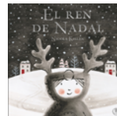
El ren de Nadal Nicola Killen