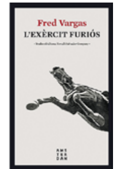
L'exèrcit furiós Fred Vargas