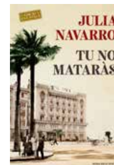
Tu no mataràs Julia Navarro