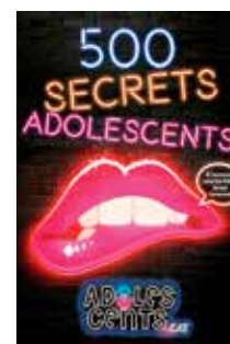
500 secrets adolescents Adolescents.cat