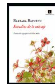
Estudios de lo salvaje Barbara Baynton