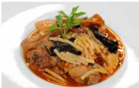
Recepta i imatge: www.lacuinadeseempre.cat

Elaboració: renteu els bolets, poseu-los en un bol amb aigua i els deixeu hidratar mínim 20 minuts. Talleu a daus la carn, el xoriç i el pernil salat, i trinxeu la ceba i el pebrot. Poseu a escalfar un bon raig d'oli d'oliva en una cassola i salpebreu la carn. Daureu la carn i, quan hagi agafat color, afegiu-hi els alls sencers, les fulles de llorer, la ceba i el pebrot, i deixeu-ho sofregir tot plegat. Quan la ceba sigui transparent, ja hi podreu afegir el xoriç i el pernil. Remeneu durant un parell de minuts i afegiu-hi els bolets hidratats sense l'aigua, que heu de conservar. Tireu-hi un bon raig de vi blanc i deixeu-ho coure uns minutets fins que s'evapori l'alcohol. Poseu a escalfar el brou i afegiu-hi l'aigua d'hidratar els bolets (no la tireu tota, ja que al fons hi pot quedar sorra). Un cop s'ha evaporat l'alcohol del vi, afegiu-hi el tomàquet i ho deixeu coure 5 minuts. Incorporeu els fideus i deixeu que es torrin una mica, tot remenant durant 2 o 3 minuts. Aboqueu-hi el brou fins que ho cobreixi tot i saleu-ho una mica. Quan els fideus estiguin cuits, rectifiqueu de sal i pareu el foc. Deixeu reposar el plat uns 10-15 minuts abans de servir-lo.