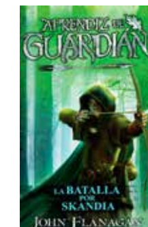
La batalla por Skandia John Flanagan