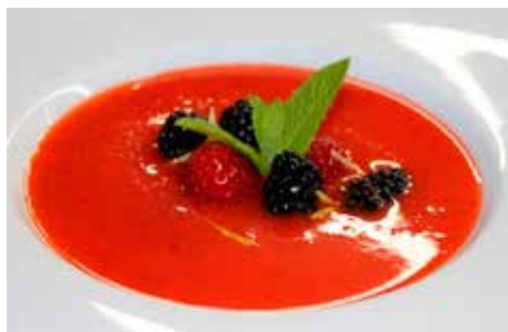
Recepta i imatge: www.lacuinadesempre.cat

Elaboració: feu un almíbar amb el sucre i l'aigua. Remeneu-los bé i un cop arrenqui el bull espereu un minut aproximadament (que es fongui el sucre) i ja podreu apagar el foc. Deixeu-lo refredar a temperatura ambient. Mentrestant, prepareu les maduixes. Renteu-les bé sota l'aixeta i retireu les fulles verdes i la part més blanca de les maduixes. Reserveu un parell de maduixes per persona per decorar el plat. Un cop l'almíbar sigui completament fred, poseu-lo dins d'un recipient amb les maduixes. Afegiu-hi el suc de la taronja i la llimona, i una culleradeta de vinagre balsàmic. Tritureu la barreja fins deixar-ho ben fi i reserveu la sopa a la nevera almenys dues hores, que agafi fred. Per emplatar, col·loqueu unes fruites al fons del plat i aboqueu-hi la sopa. Poseu-hi també trossets de fruita per sobre.