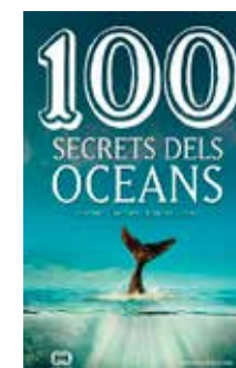
100 secrets dels oceans E. Garcés i D. Closa