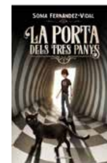
La porta dels tres panys Sonia Fernández-Vidal