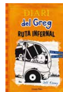
Diari del Greg. Ruta infernal Jeff Kinney