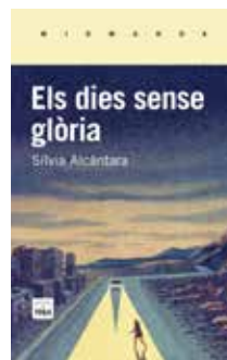
Els dies sense glòria Sílvia Alcántara