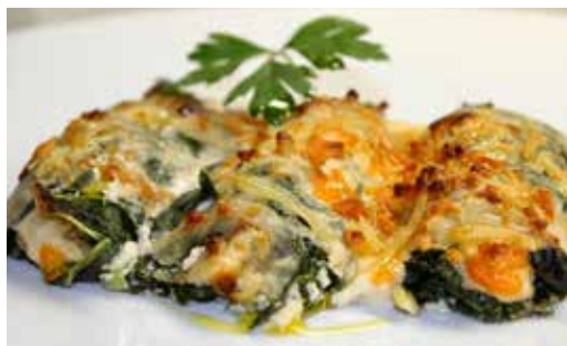
Recepta i imatge: www.lacuinadesempre.cat

Elaboració: cuinarem aquest plat amb el sobrant de la carn d'olla de l'escudella. Talleu cada ingredient a trossets i retireu els ossos, la pell i les parts més dures. Podeu posar-hi tot el què tingueu: vedella, porc, cigrons, pastanaga, botifarra... Per començar, feu la beixamel. Quan estigueu, tritureu la carn d'olla, afegiu-hi un parell o tres de cullerots de beixamel i tritureu de nou. Reserveu la resta de salsa. Afegiu-hi més o menys beixamel segons el vostre gust, però assegureu-vos que us queda una textura similar a la de les croquetes. Deixeu refredar la pasta a temperatura ambient tapada amb paper film.