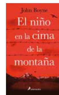
El niño en la cima... John Boyne