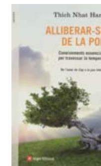
Alliberar-se de la por Thich Nhat