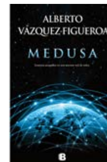
Medusa Alberto Vázquez-Figueroa