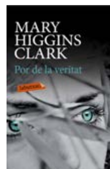
Por de la veritat Mary Higgins Clark