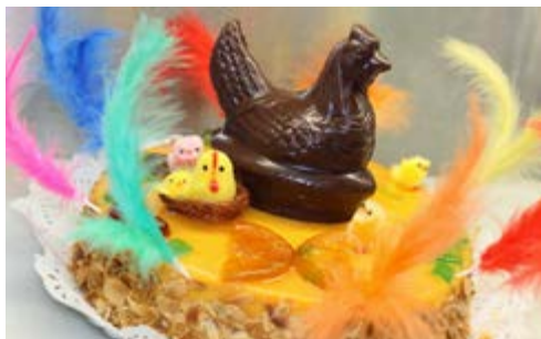
Recepta i imatge: www.lacuinadesempre.cat

Elaboració: primer de tot, repeleu el pa de pessic i talleu-lo per la meitat per poder-lo farcir. Agafeu l'almívar i afegiu-li un 30% de brandi, la mescla que serà el sucre bany per banyar el pastís, barregeu-ho bé i banyeu la capa inferior del pastís. Farcieu el pastís amb una capa generosa de la mermelada que més us agradi (treballeu-la abans amb gelatina per fer-la més untable). Tot seguit, poseu-hi la capa superior, feu una lleugera pressió i torneu a banyar el pastís amb sucre bany. Després, escampeu la gema pastissera pel pastís i reserveu-lo. Poseu a escalfar la gelatina de poma, amb un 80% de gelatina i un 20% d'aigua. Quan arrenqui el bull pareu el foc. Per a decorar, utilitzeu fruita confitada i després ja podeu pintar tota la mona amb la gelatina. Als costats hi podeu posar ametlla ratllada. Finalment, col·loqueu-hi les peces de xocolata i les figuretes.