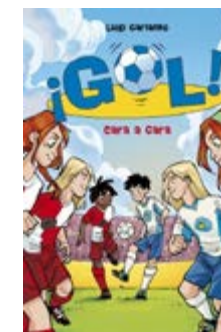
Gol! Cara a cara Luigi Garlando