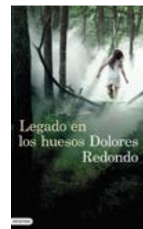
Legado en los huesos Dolores Redondo