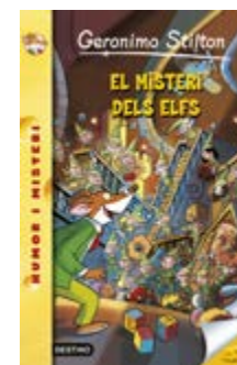
El misteri dels elfs Geronimo Stilton