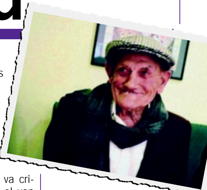
En Mateu en una fotografia de l'any passat. A la fotografia inferior, amb la seva nombrosa família. Ell és el primer de la dreta.

Una seva germana va cridar la mare. Quan el van treure del riu, estava mig mort. Des de aleshores li va quedar una deficiència a la