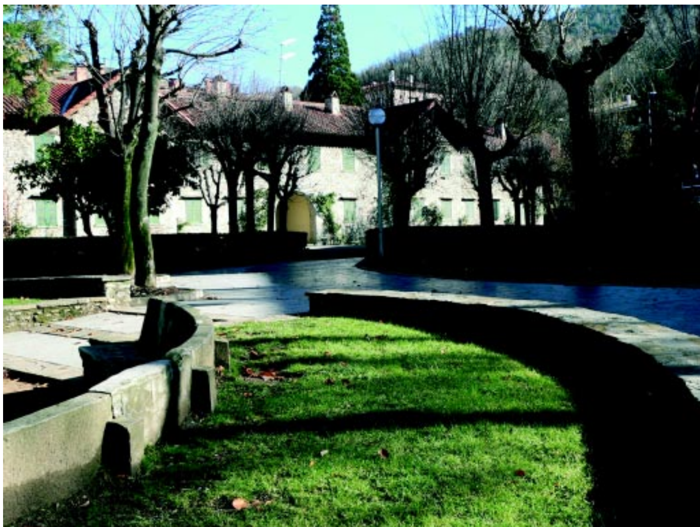
La Colònia Espona, juntament amb la residència geriàtrica, forma un conjunt perfectament urbanitzat

dació va presentar-se al concurs que havia preparat l'Ajuntament i en va ser declarat, com dèiem, el concessionari.